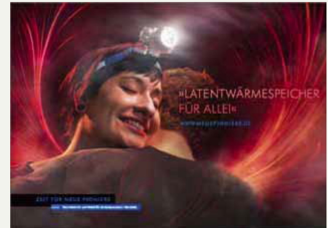
Format: 3.560 x 2.520 mm